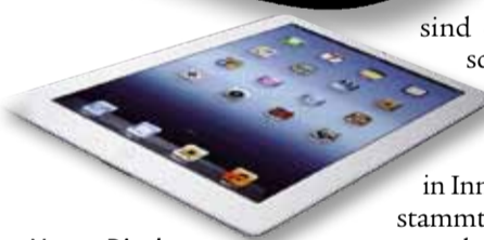
Neues Display: Das iPad 3 soll besser sein als ein HDTV-Fernseher.