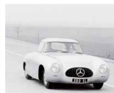
Luxus nach Kriegsjahren: Der 300 SL 1952 auf der heutigen A81.

Stuttgart. Zum 60. Mal hat sich am 12. März die Präsentation des Mercedes Benz 300 SL geährt. Gleich in der ersten Rennsaison kassierte der Flitzer mehrere Siege und begründete damit auf Anhieb einen Mythos. Mercedes erlangte mit dem SL (Super-Leicht) nach dem Krieg wieder die alte Strahlkraft zurück.