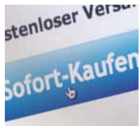
Klare Sache: Wer hier klickt, bezahlt.

Demnach kommt ein Vertrag nur zustande, wenn der Kunde ausdrücklich bestätigt, dass er etwas kaufen will. Dafür muss der Button, der die Bestellung auslöst, eindeutig beschriftet sein.